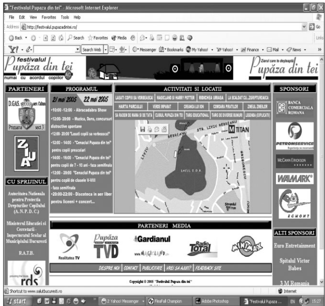
Site realizat de Marius Androne